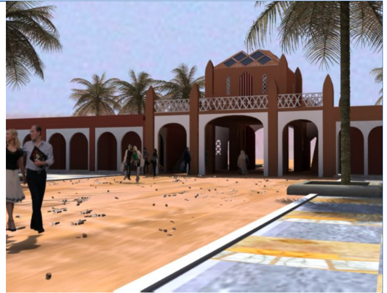
Vue de l'intérieur de Dar el Imzad 16 boutiques sous les arcades de part et d'autre de l'entrée principale

Dans le cadre du commerce équitable, il est prévu de mettre en place des espaces pour permettre aux artistes et artisans locaux de commercialiser directement leurs produits. .